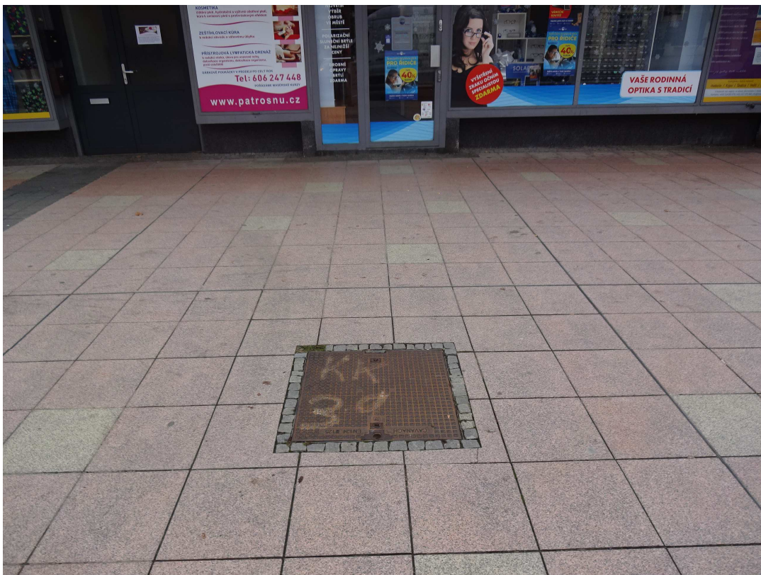
náhled na šachtu Š4