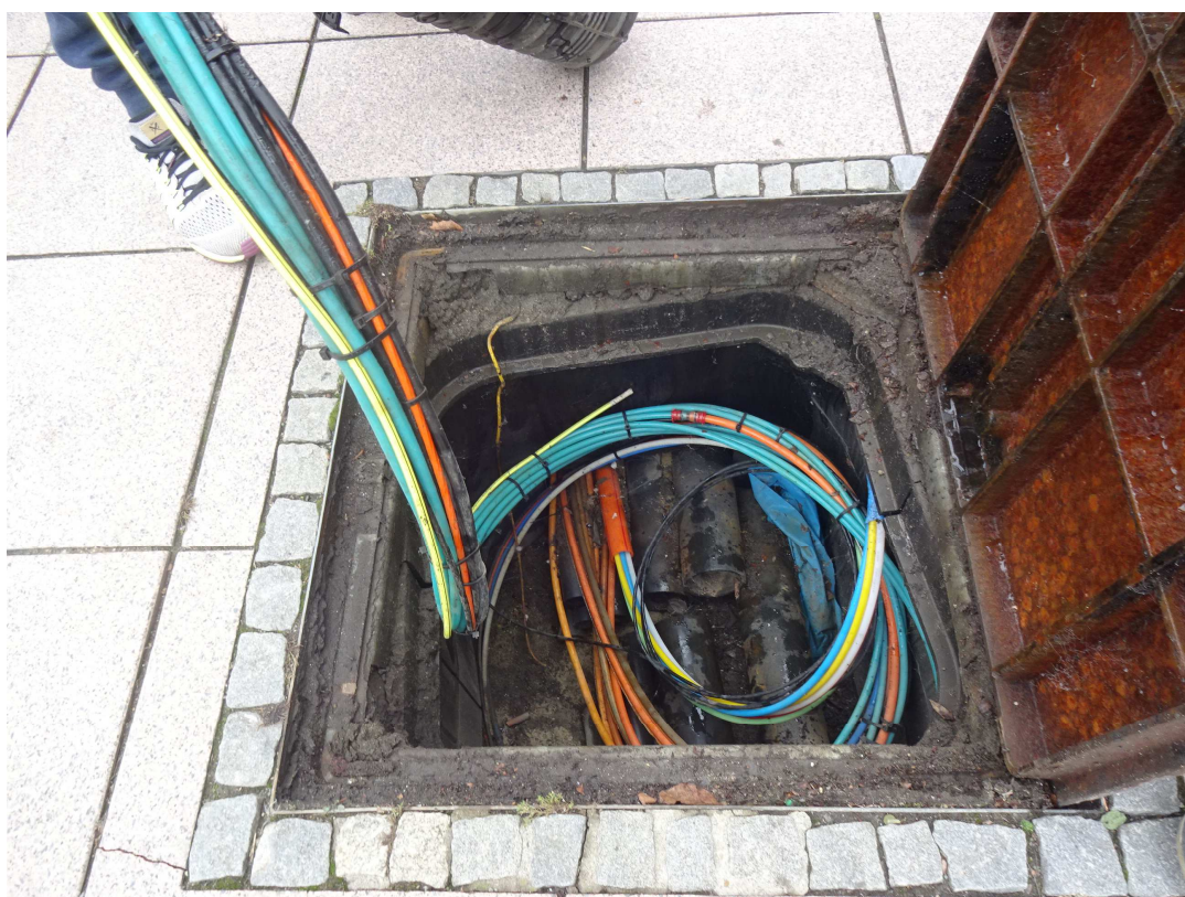
detail šachty Š4