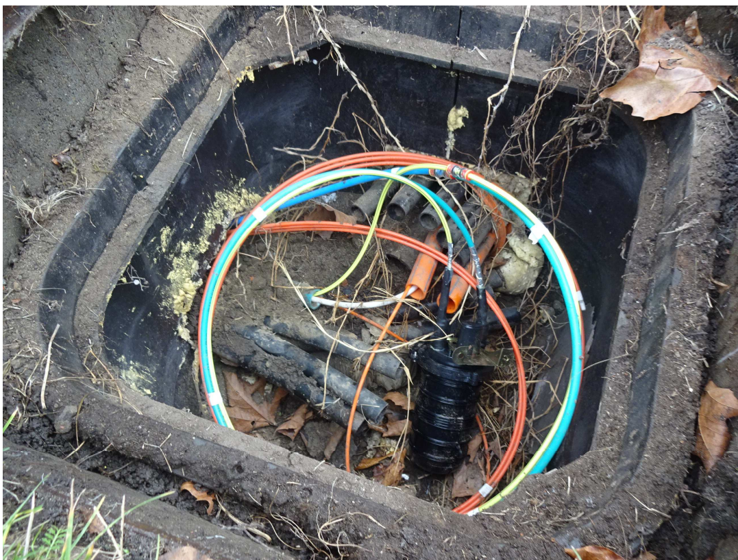
detail šachty Š2