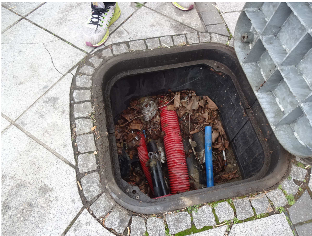
detail šachty Š3