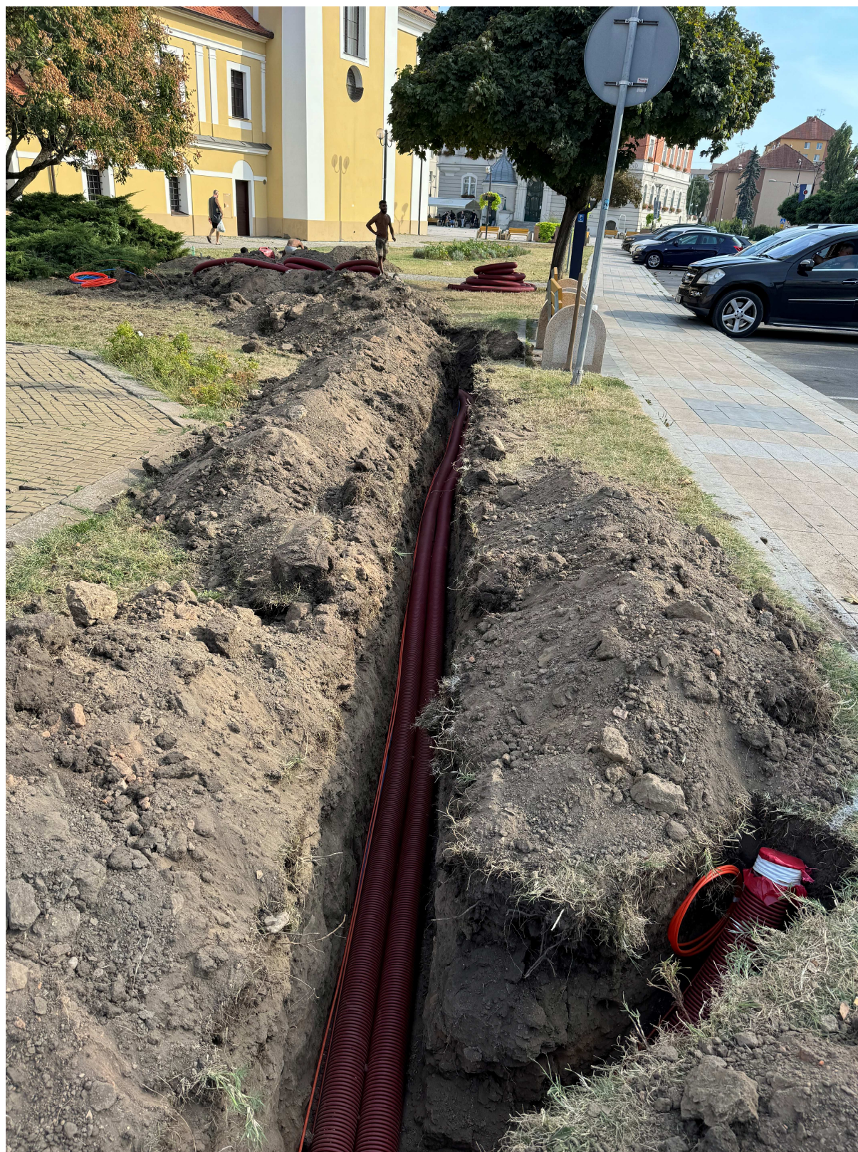
připravené kabelové chráničky u kostela