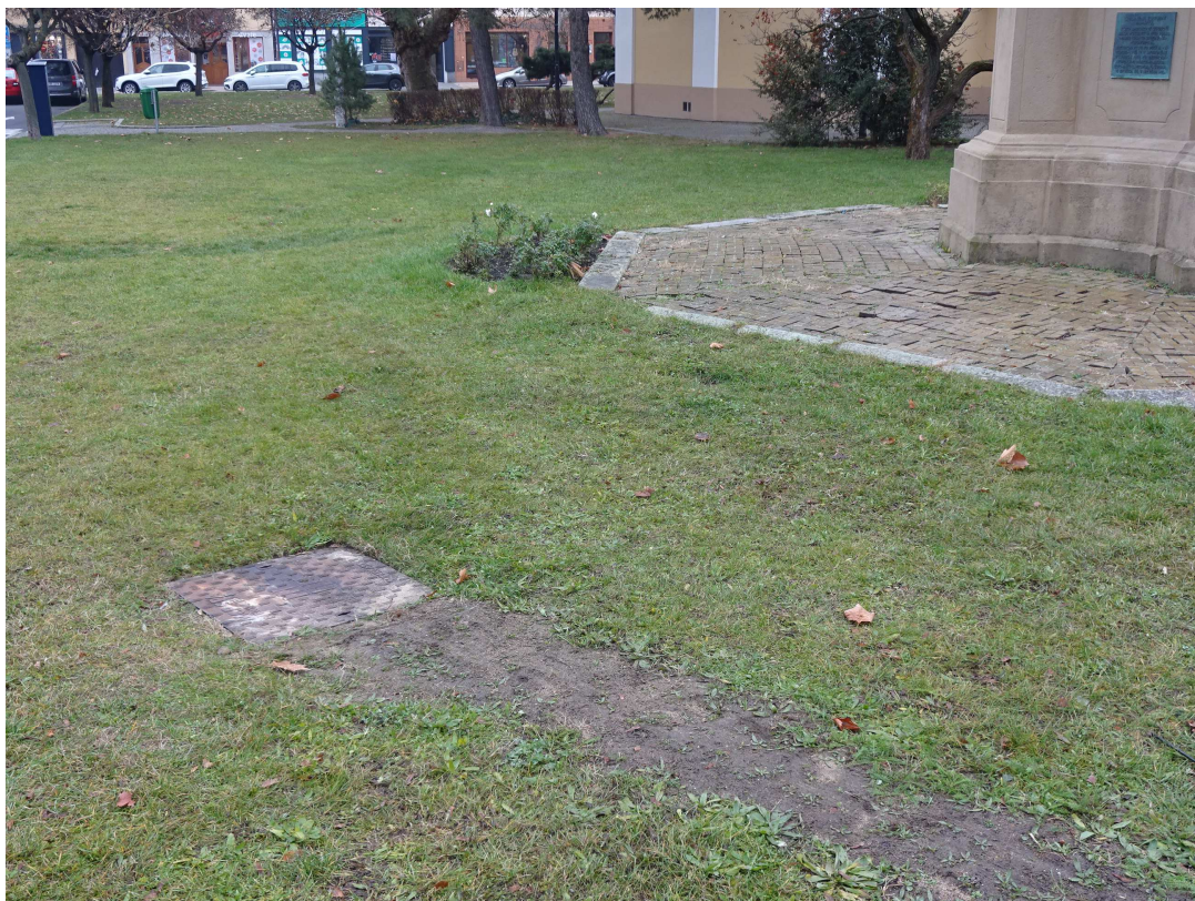
náhled na šachtu Š2