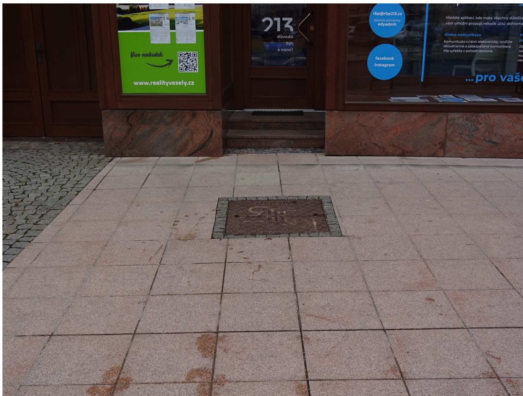
náhled na šachtu Š1