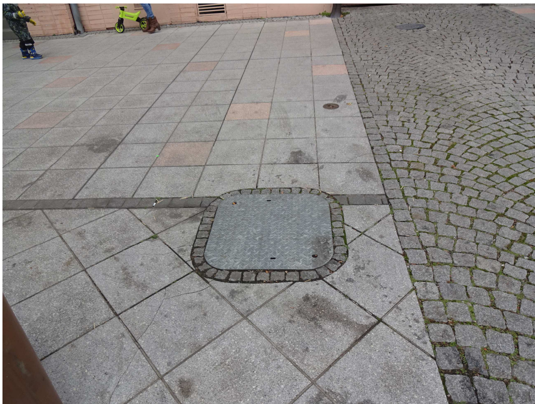
náhled na šachtu Š3